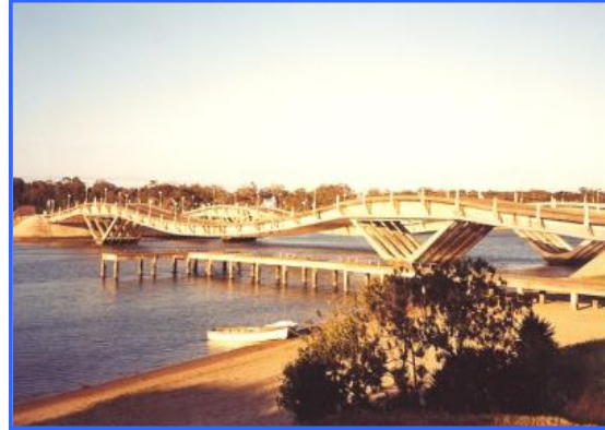
Brücke in Punta del Este

Umsteigen. In Buenos Aires verlief alles ganz ohne Probleme. Nach Montevideo war nicht mehr viel los. Das Flugzeug war zu einem Fünftel gefüllt, so dass jeder eine Reihe für sich hatte. Gut, die Landung war ein bisschen holprig, da Windstärke 5-6 herrschte. Mit den Visa hat alles geklappt, und keiner ist aufgehalten worden. Am Flughafen haben wir uns von den anderen verabschiedet und sind losgefahren. Hier fahren Autos, die es in Deutschland schon gar nicht mehr gibt - vielleicht sogar nie gegeben hat, z. B. getunte Käfer oder BMWs von 1975. Sie funktionieren aber alle noch und sehen ganz lustig aus. Die Fahrt nach Punta del Este ging relativ schnell. Die Stadt ist soooo schön!