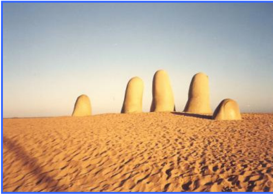
Das Wahrzeichen von Punta del Este

¿Todo bien en Alemania? Hier ist es jawohl total toll! Ich hatte gestern meinen ersten Schultag. War sehr gut. Ich bin ganz erstaunt, wie gastfreundlich hier alle sind. Und auch so interessiert. Als ich ankam, sind gleich fünf Leute auf mich zugekommen und haben mich gründlich ausgefragt. Sind alle supernett.