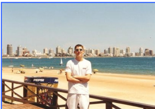
am Strand von Punta del Este