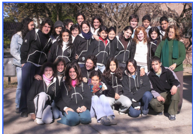
Meine neuen Klassenkameraden

Trotz Nervosität und Kommunikationsschwierigkeiten erschien mir meine Gastfamilie sehr herzlich, meine Gastschwester sehr sympathisch, das Haus sehr schön, die Schule locker, meine Klassenkameraden sehr hilfsbereit...und in der ersten Woche merkte ich, wie sich mein Vokabelschatz von Tag zu Tag von selbst erweiterte. Das Lernniveau an meiner argentinischen Schule war nicht ganz so hoch wie ich es aus Deutschland kenne, dafür der Lautstärkepegel umso mehr. In meine Klasse gingen 40 Schüler, die wirklich mit offenen Armen auf mich zugegangen sind. Als Austauschschülerin war ich in Argentinien noch etwas extrem Besonderes und stand oft im Mittelpunkt des Geschehens. Anfangs fand ich das eher störend, aber dadurch habe ich an meiner neuen Schule auch schnell Bekanntschaften geschlossen. Mit der Zeit hatte ich mich aber an meinen Sonderstatus gewöhnt.